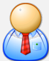
Formatore / formatrice

Ora clicchi su "Formatore" per accedere al modulo della registrazione.